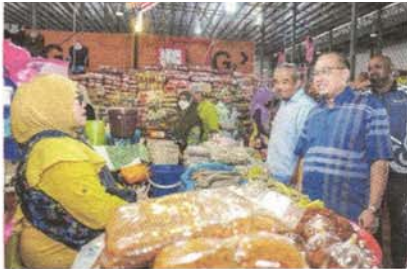
Mendengar maklumat dan aduan dari peniaga.