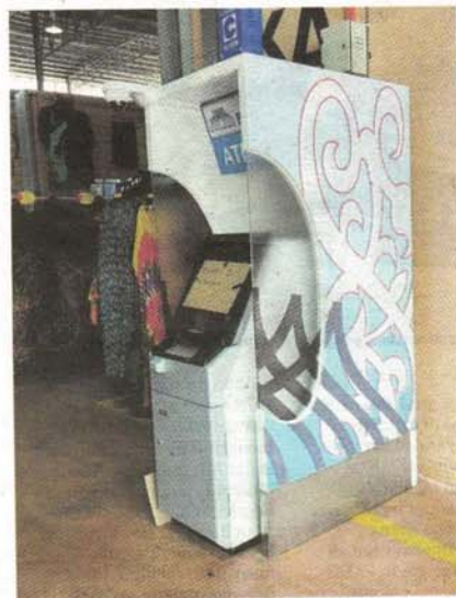
Mesin ATM di Pasar Payang.