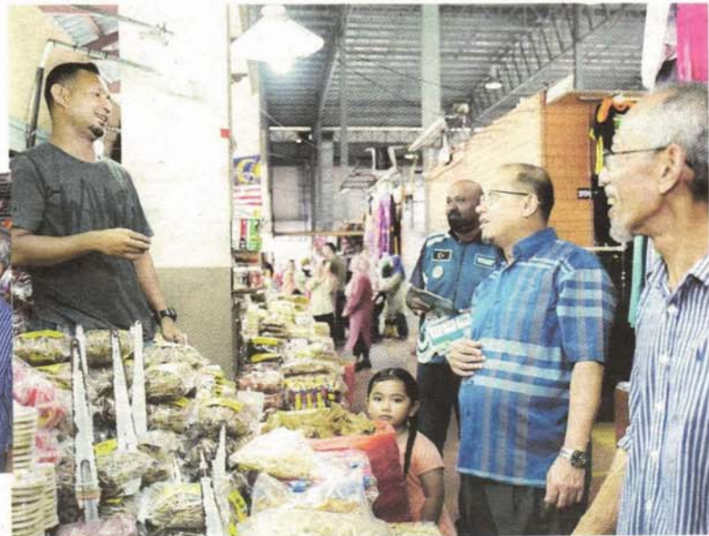
Bertanya perkembangan dengan seorang peniaga keropak.