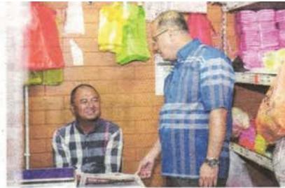
Bertanya khabar seorang peniaga di Pasar Payang.