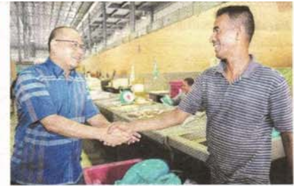
Mesra dengan semua peniaga di Pasar Payang.